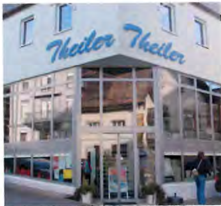
Maison Theiler, Einsiedeln