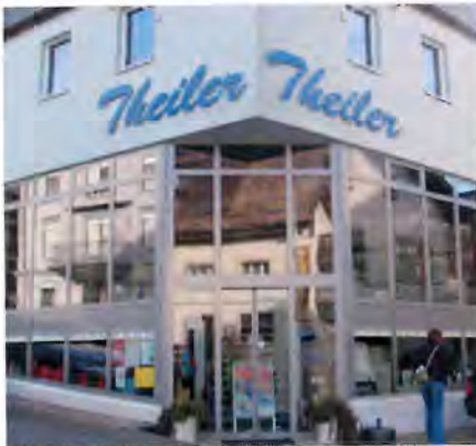
Haushaltwaren Theiler, Einsiedeln