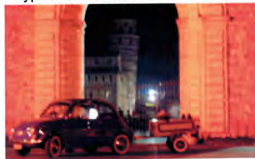
500 à Pise à 3.00 h du matin