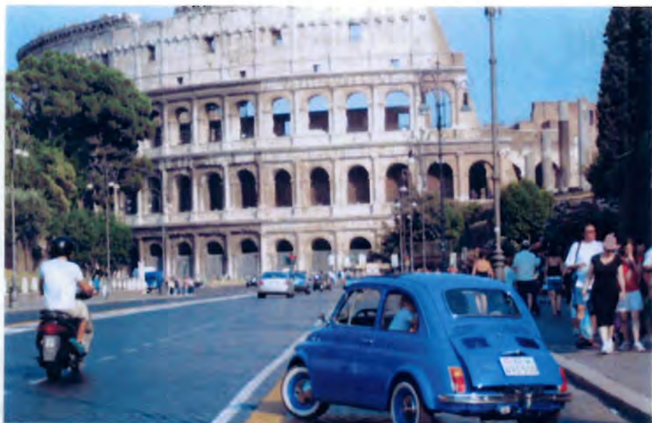
Famille Caillet en 500 à Rome